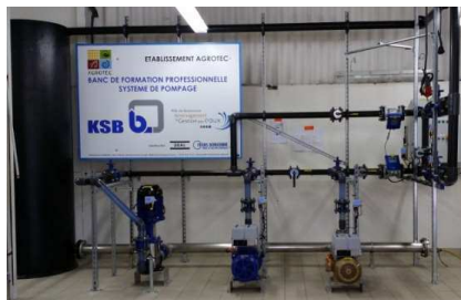
Banc de système de pompage