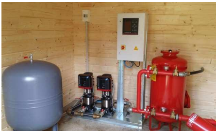
Station de contrôle du réseau d'irrigation